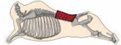
GRÁFICO DE LA RES

Este corte no debe contener hueso. En ambos extremos debe ser recto. Se ubica en la columna vertebral del animal, desde la última vértebra lumbar y la cadera hasta la décimo tercera costilla. El cordón del lomo debe retirarse. No debe realizarse una limpieza exhaustiva de la grasa y del tejido conectivo de la misma. Músculo "Longissimus lumborum".